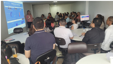
Aula presencial do Curso de Formação de Conciliador Judicial

A certificação se dará ao final da conclusão e aprovação da etapa teórica e da conclusão de ao menos 60 (sessenta) horas de estágio. O certificado será fornecido mediante relatório final do estágio e termo de compromisso.